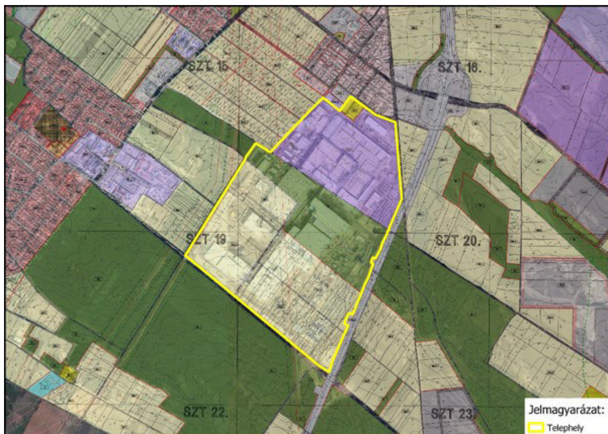
1. ábra Telephely és környezete

A rendezési terv szerinti területi besorolásokat az alábbi ábrán szemléltetjük: