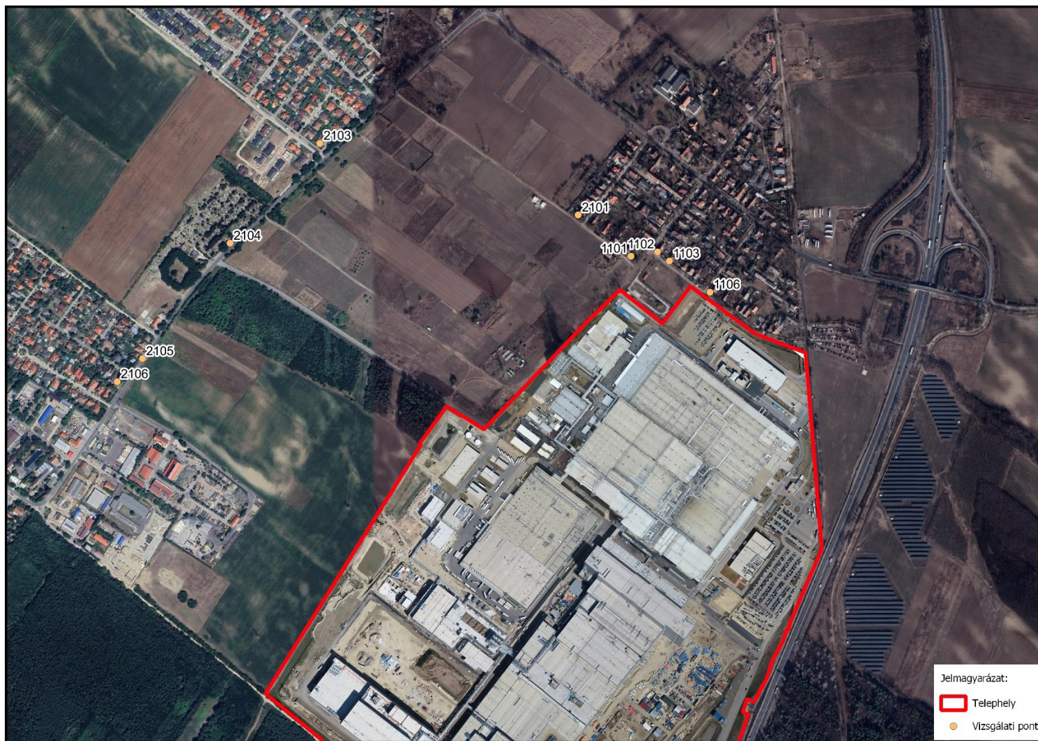
3. ábra Zajmérés pontok

A mérési pontok helyét az alábbi ábrán mutatjuk be: